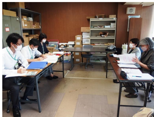
伊藤秀晴仙台市健康福祉局保険高齢部部長(左側中央)との懇談